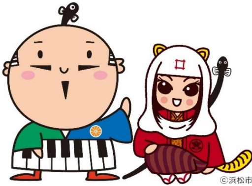
出世大名 家康くん 出世法師 直虎ちゃん